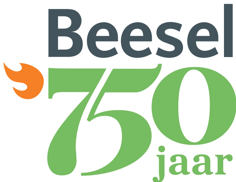
Logo normaal - full colour